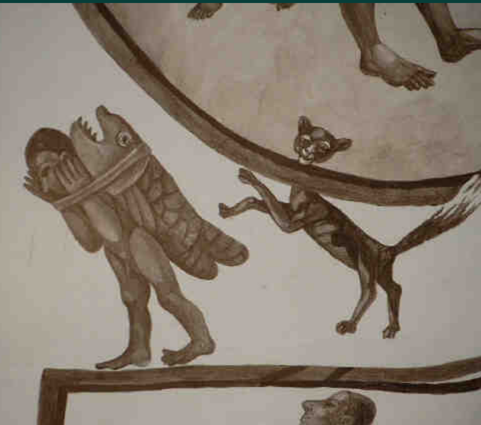
Ausschnitt